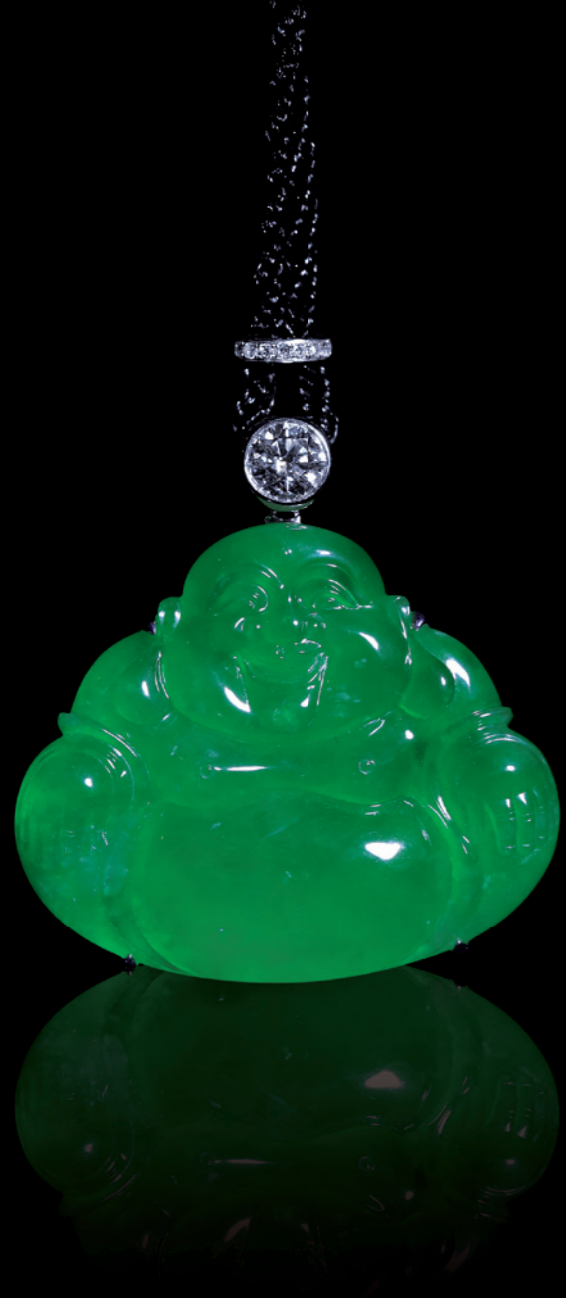
2035 緬甸天然老坑玻璃種翡翠（配鑽石“彌勒佛”吊墜）

主鑽0.81ct 附GIA證書 配鑽石2.682ct 41.26 × 34.85 × 6.58mm