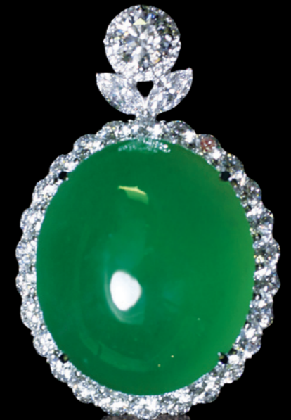
2019 緬甸天然翡翠（配鑽石“蛋面”吊墜）