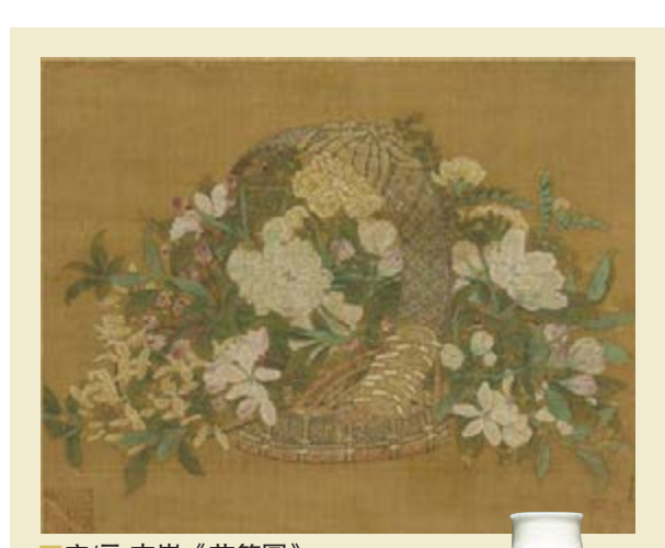
■乾隆粉青地開光粉彩四季花卉紋象耳海棠式尊

本季秋拍首輪，在經濟下行壓力大增的大環境下，本港各大行仍共創下近43億港元總成交額，交出了滿意的成績單。接着的第二波，由香港佳士得壓軸出場，將於本月27日至下月2日假香港會議展覽中心，舉辦一系列精選拍賣。佳士得能否如首輪的各家於逆市中奮發進取，所有關心香港藝術品市場的人都會翹首以待。 文：麥默