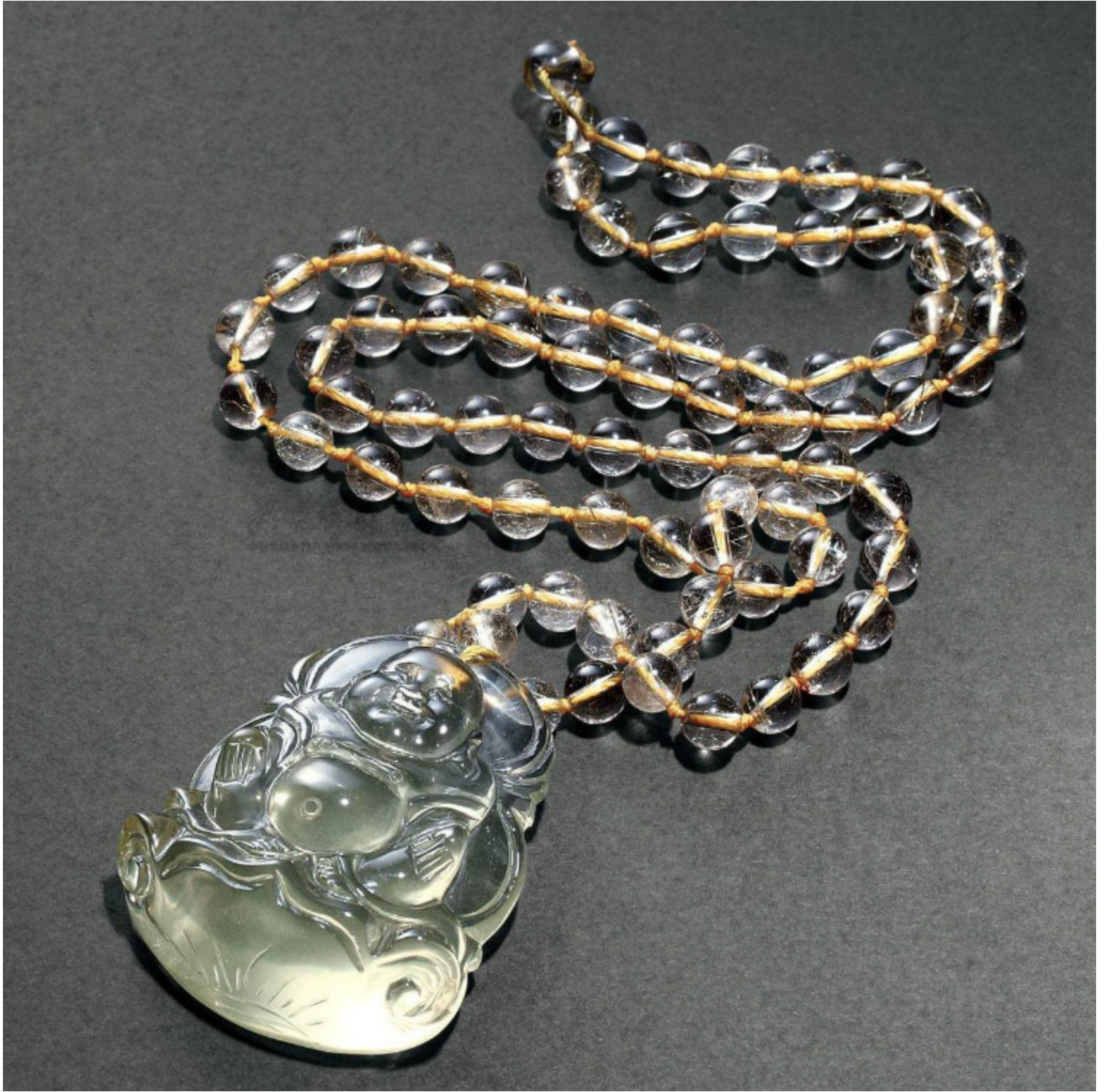
33, 水晶手鐲 D7cm RMB 550