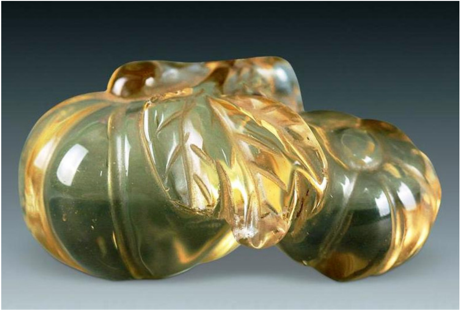
9, 清乾隆 绿水晶印章形挂坠