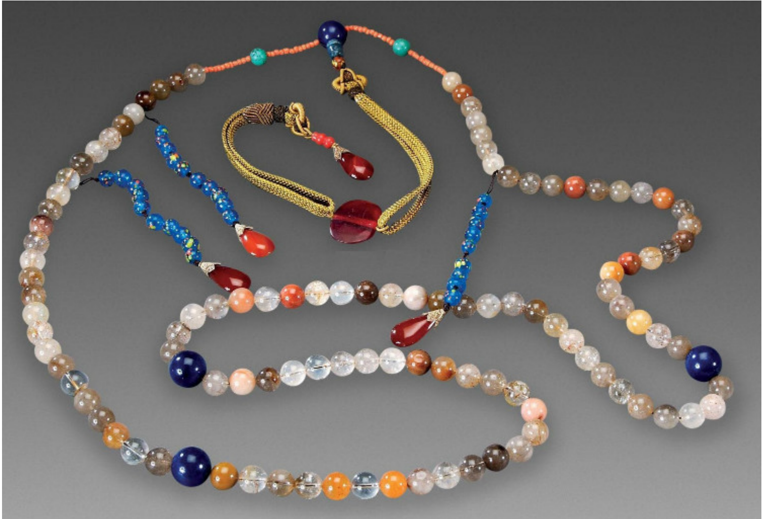
32, 清 水晶雕“弥勒”挂件 H5.3cm RMB 5040