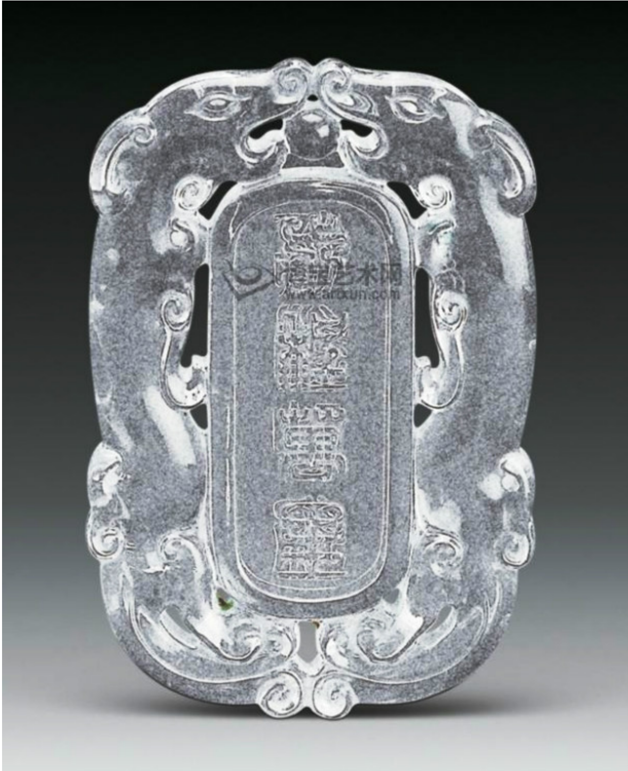
36, 水晶带钩 L9.5cm RMB 2000-4000