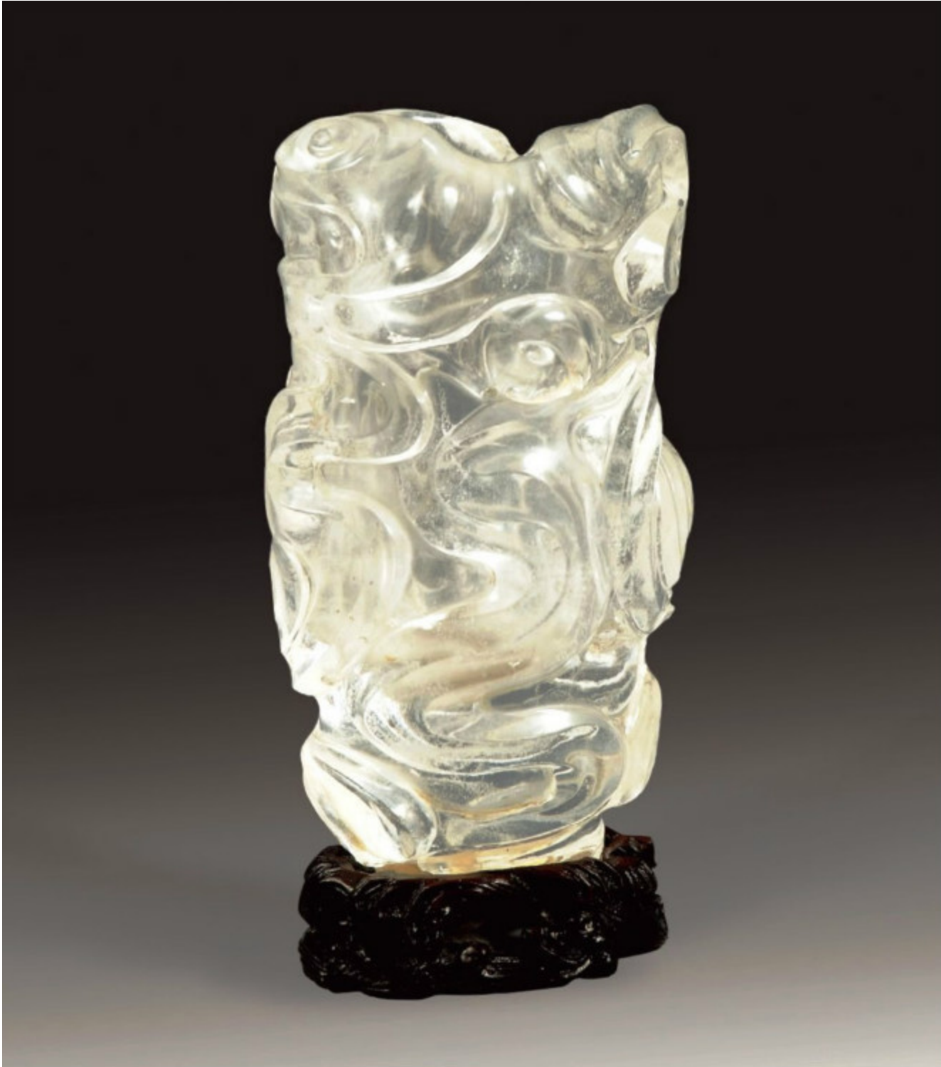
29, 清乾隆 水晶“鸭”行壶 H17.5cm RMB 862400