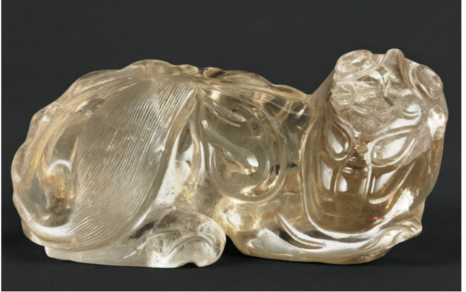
24, 元 水晶双系舍利罐 L5.8cm RMB 2530