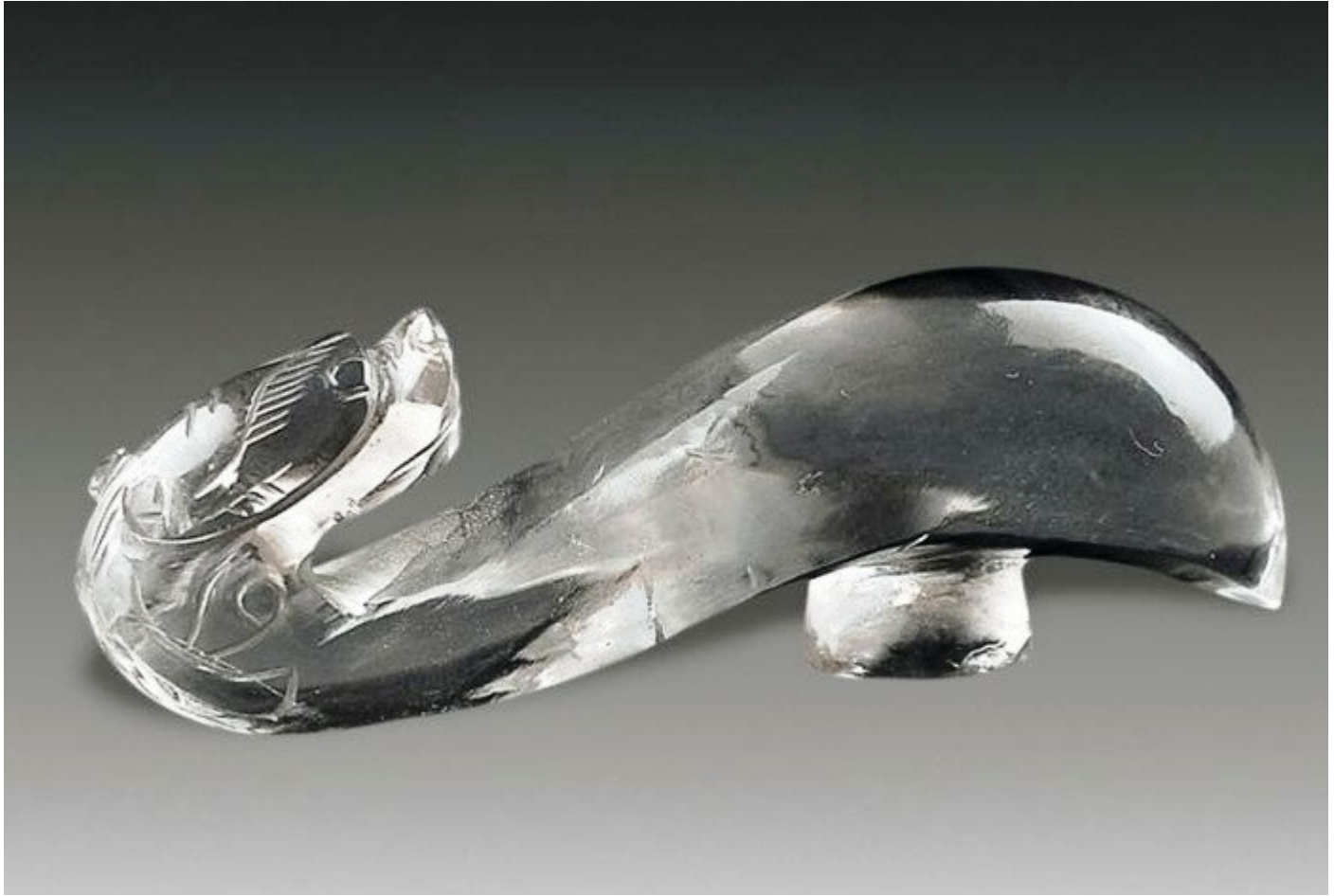
26, 明中期 水晶鱼龙变化笔山 L15cm RMB 138000