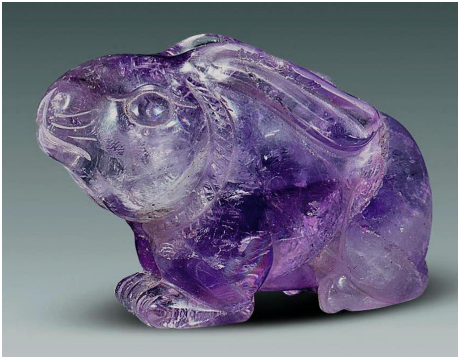
13, 清 紫水晶雕婴戏花瓶