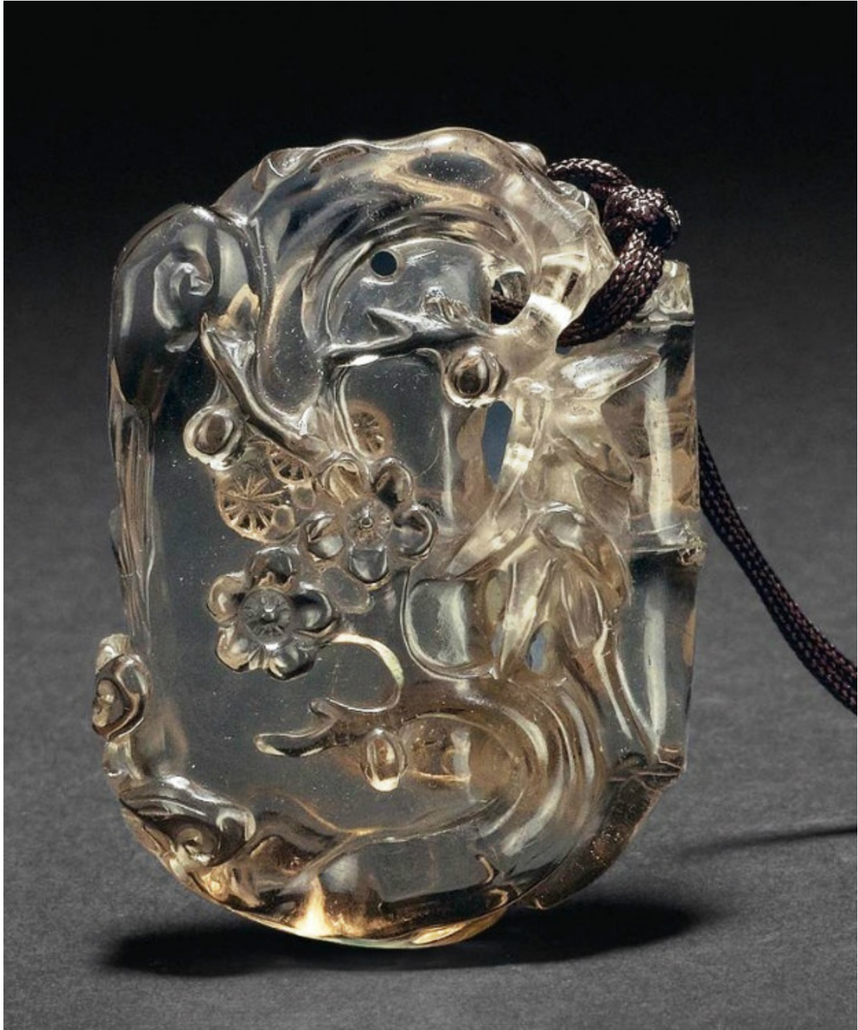
35, 水晶悟道神通珮 H7cm RMB 4400