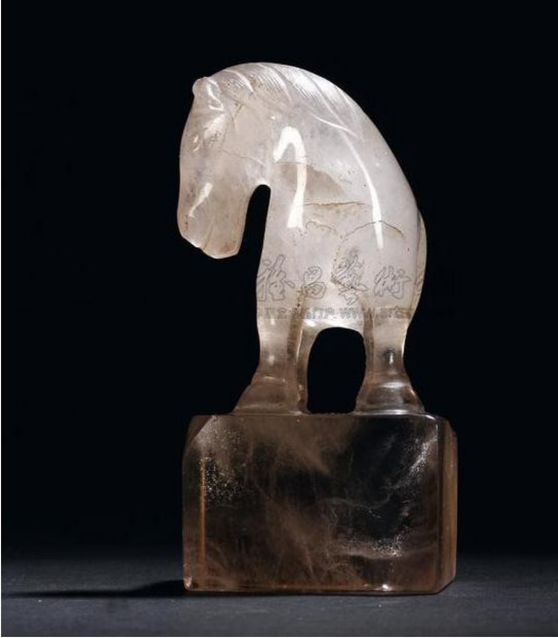
31, 水晶朝珠 RMB 2300