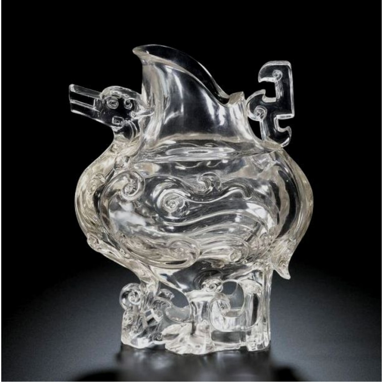
30, 清乾隆 马纽水晶印章 H10.5cm RMB 34500