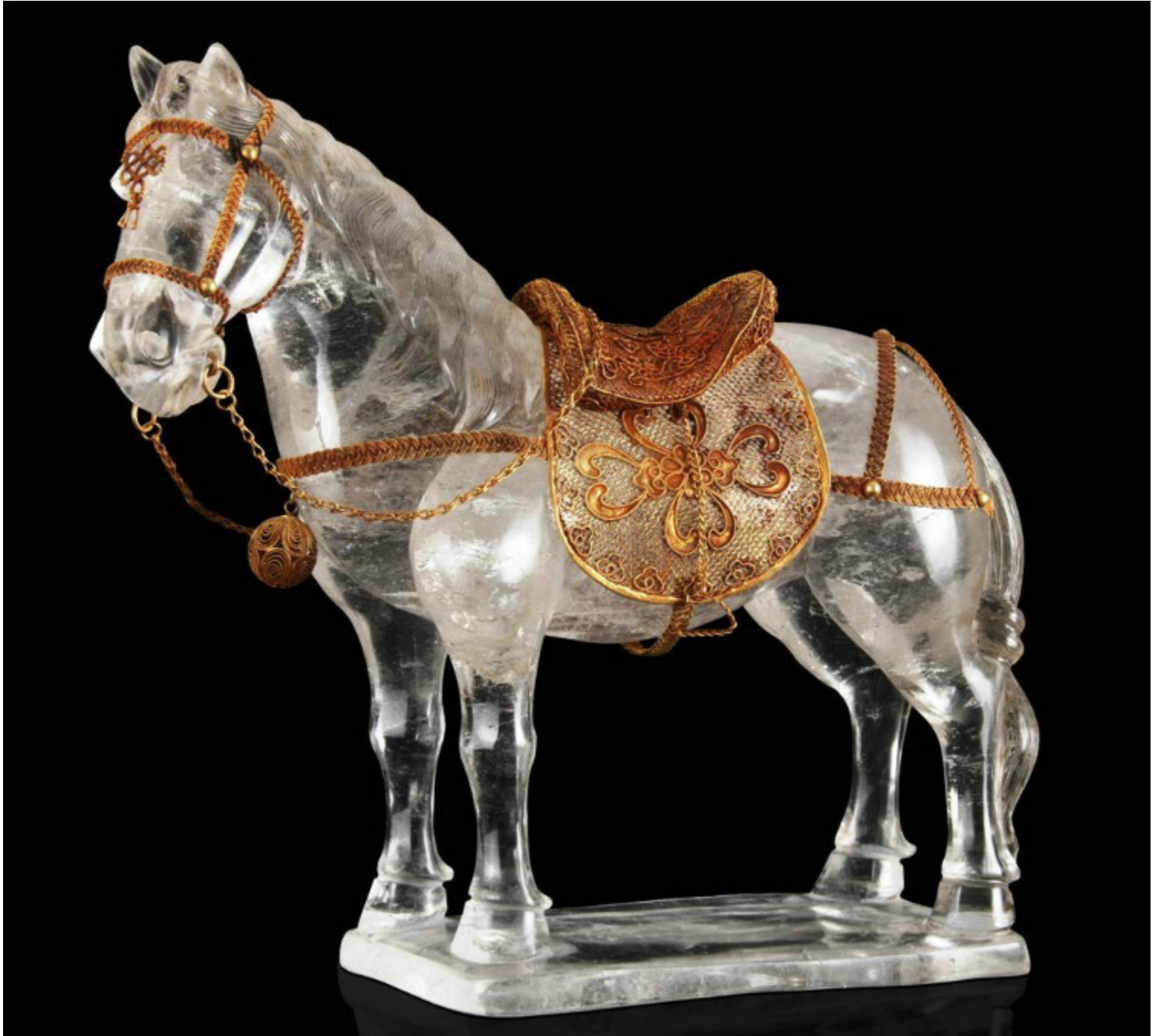
[ 唐-五代 金累丝鞍轡水晶立马-高 19cm -RMB 672000 ]