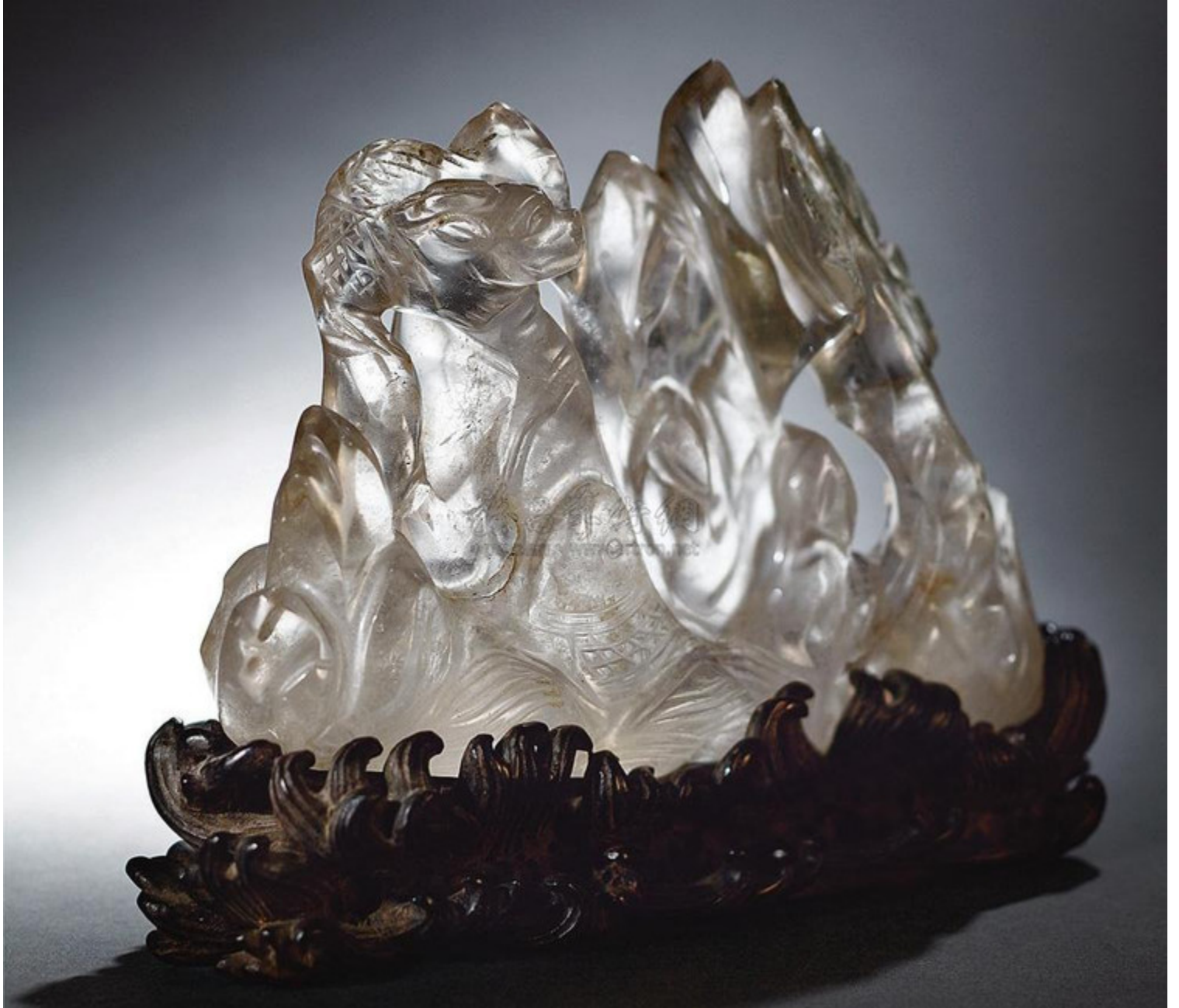
27, 清初 藕荷双螭水晶笔洗 高 4.5cm 长 15.5cm RMB 10000-18000