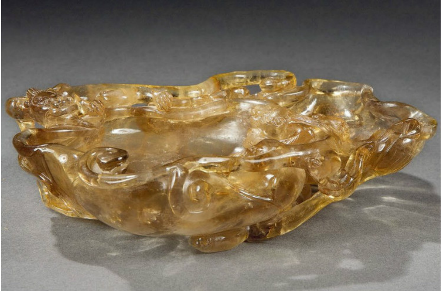
28, 清乾隆 水晶万福流云纹花插 H14cm RMB 55000-80000