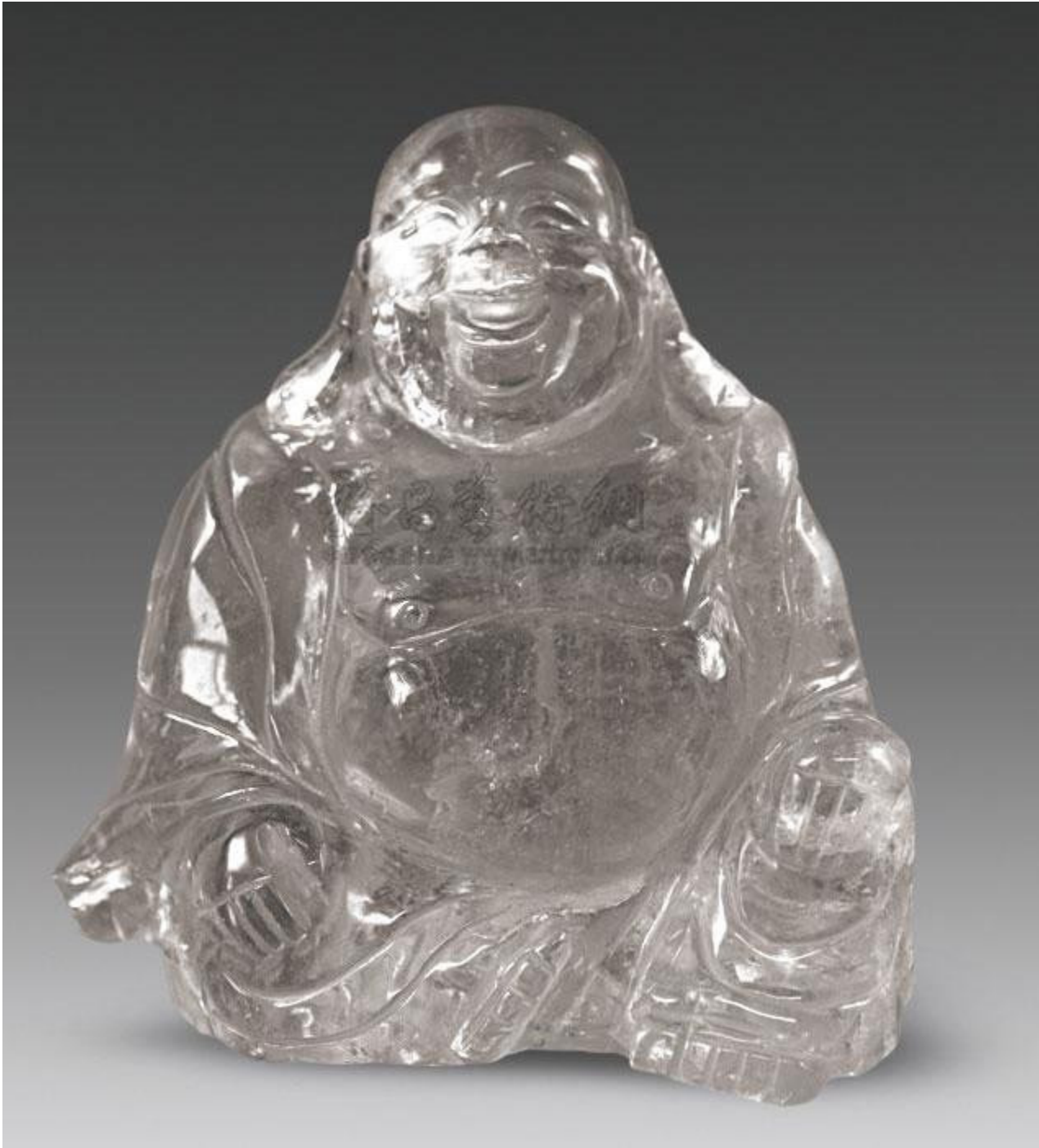
62, 清 水晶弥勒像 H13cm RMB 46000