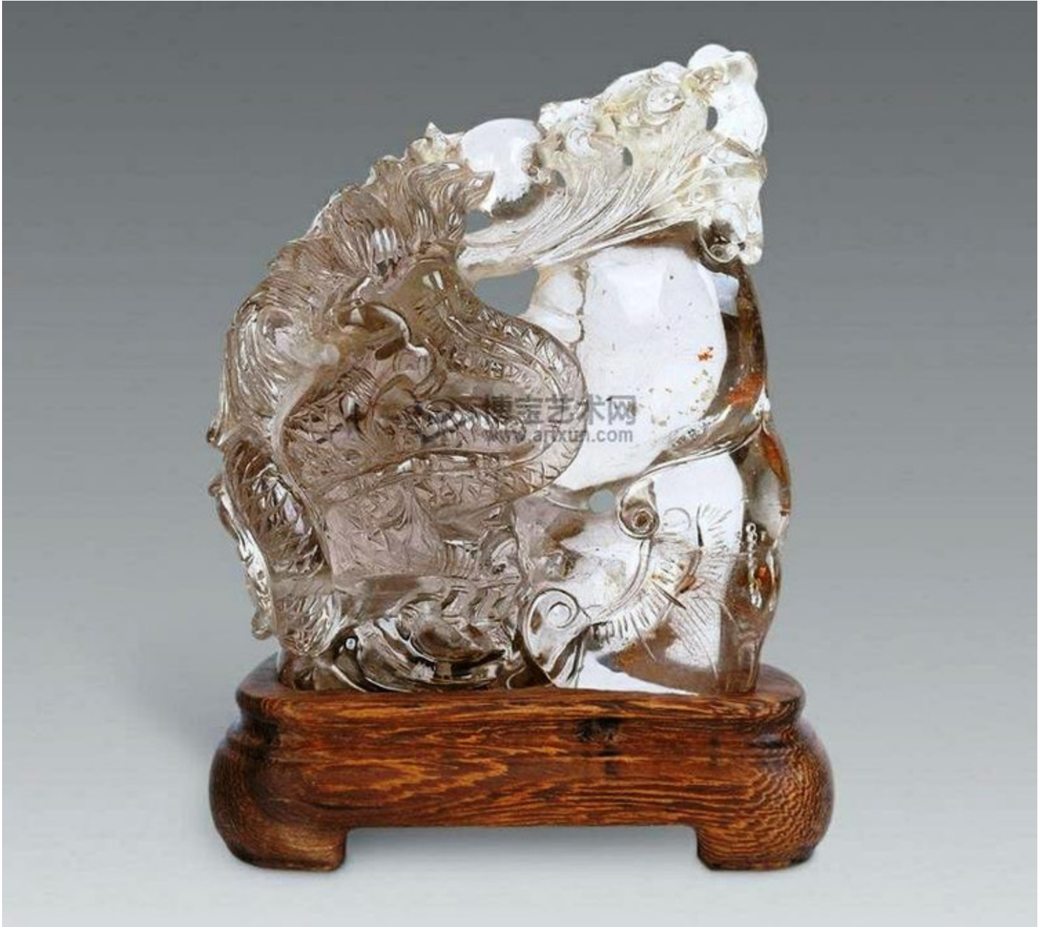
57, 清 水晶雕仙人乘槎摆件 L22cm RMB 8000