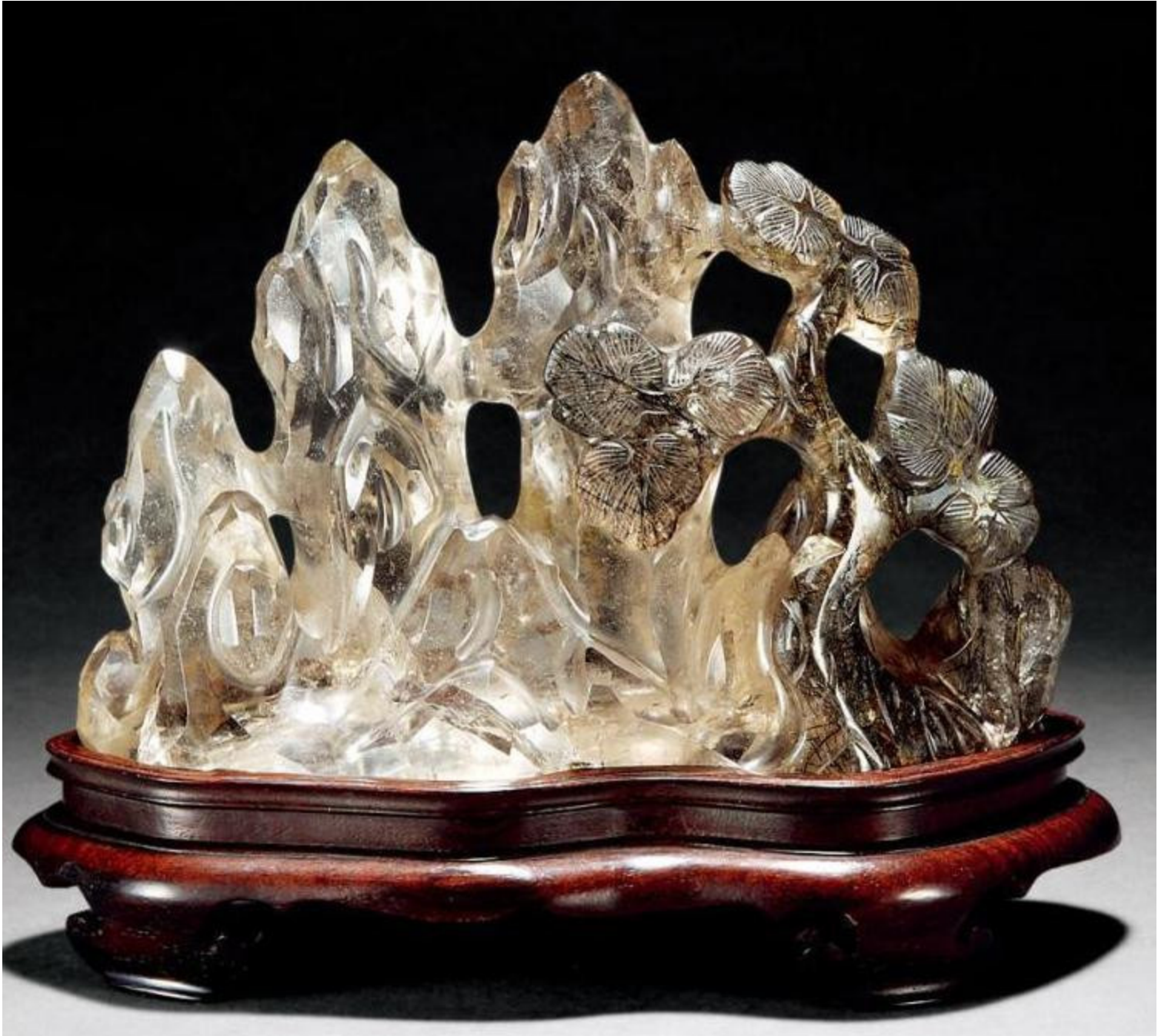
43, 水晶山子带红木原座 长 9cm 宽 3cm 高 5.5cm RMB 3520