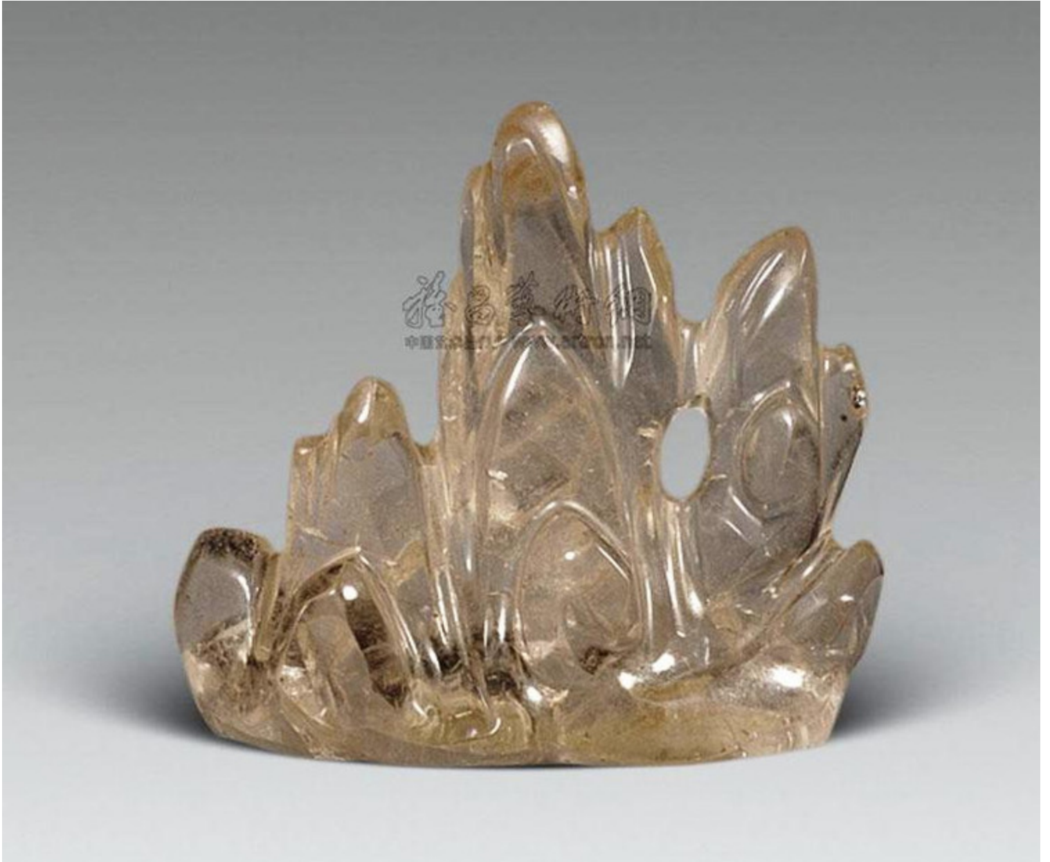
42, 水晶雕松枝随形笔山 L19cm RMB 90000-120000