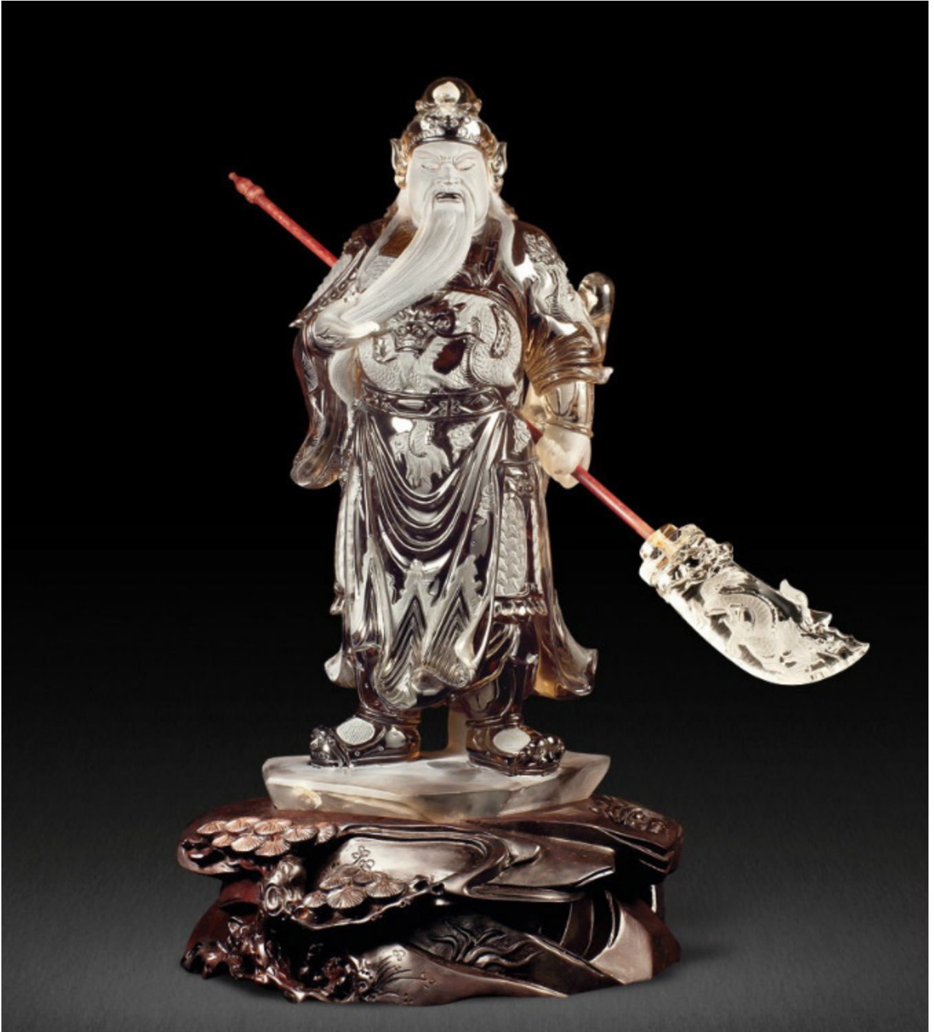
71, 春水桃形水晶印泥盒