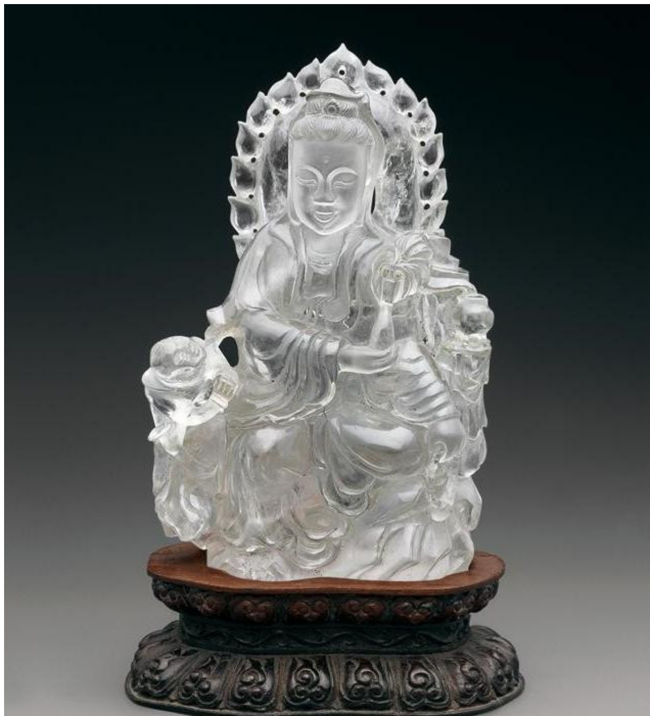
66, 水晶观音像 H21cm RMB 3360