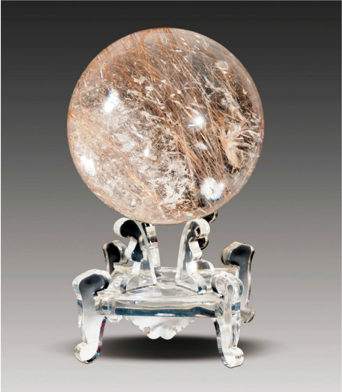
39, 天然水晶球摆件 D16.5cm RMB 350000-400000