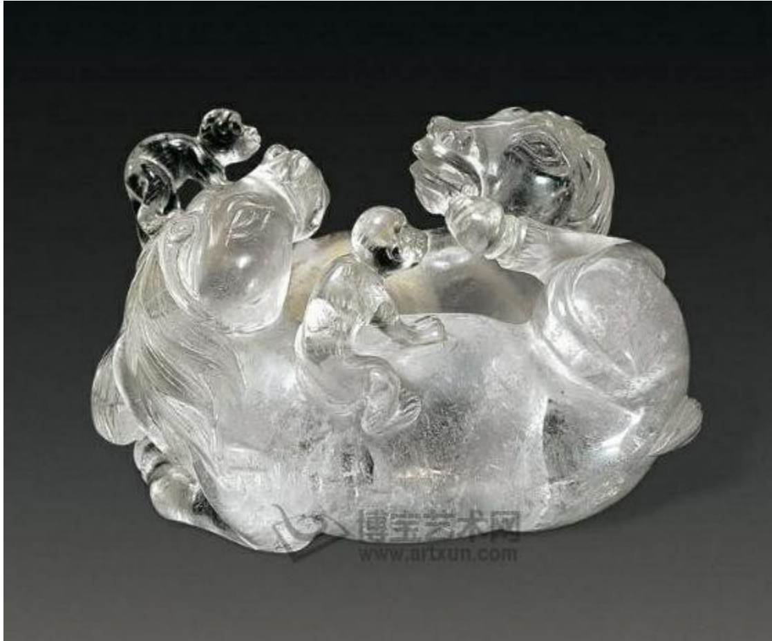
56, 水晶神龙戏水摆件 H11.5cm RMB 1980