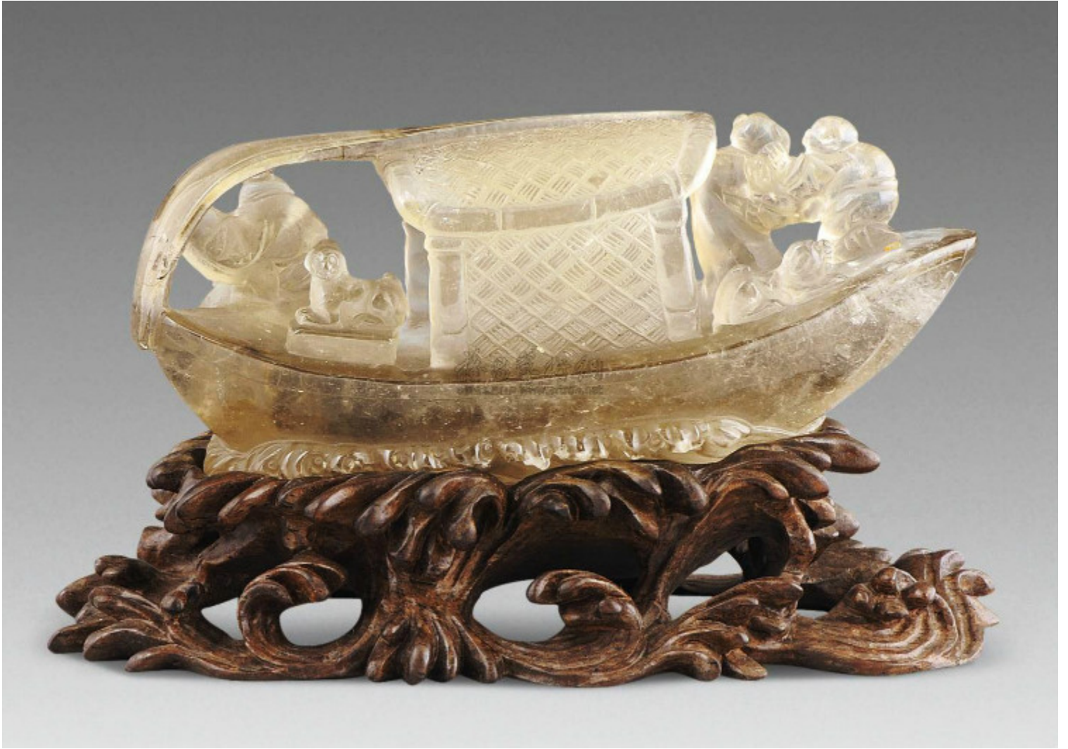
46, 清 水晶巧雕福寿摆件 H10cm RMB 20000