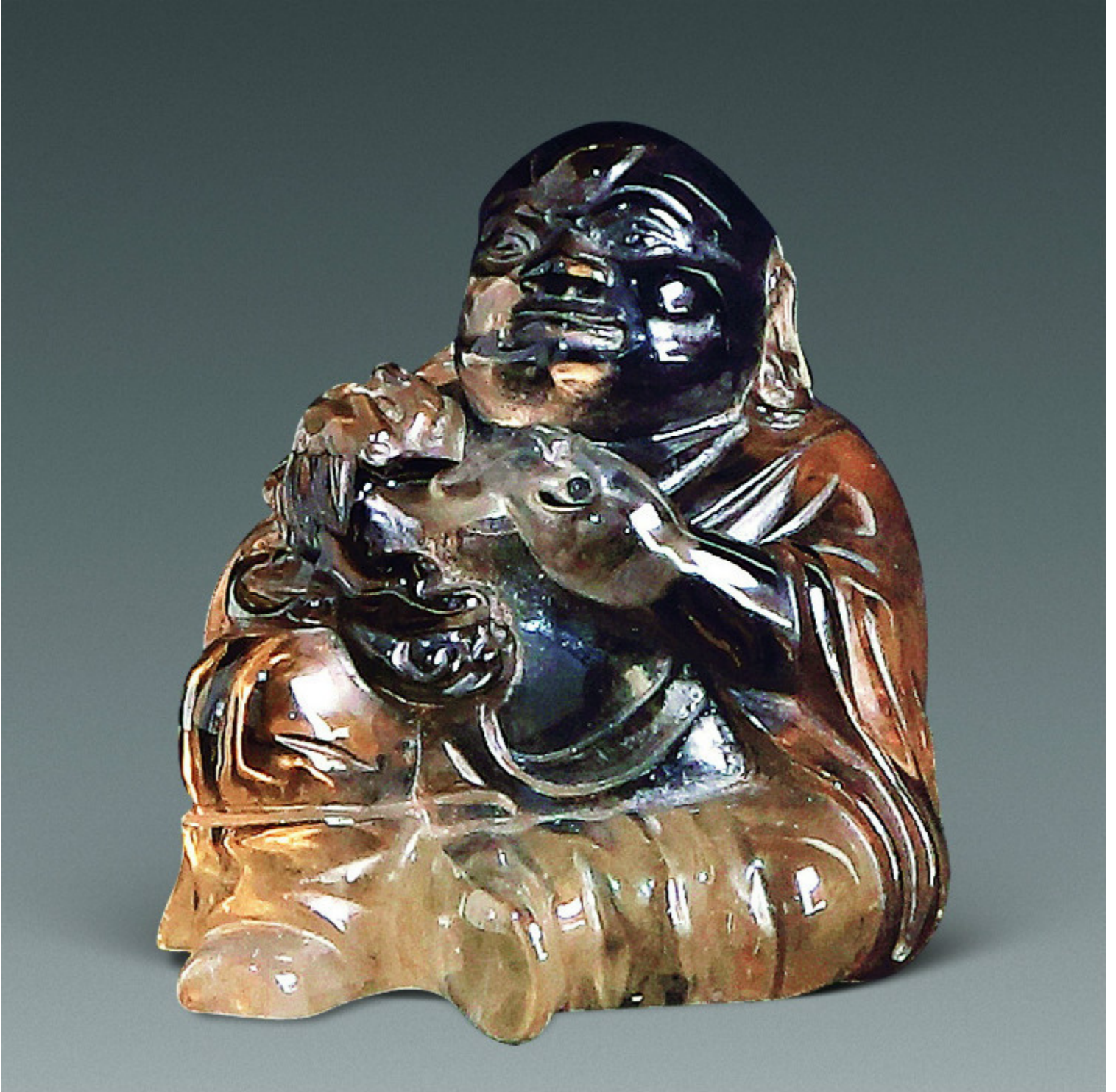
64, 清晚期 水晶观音 H16cm RMB 10350