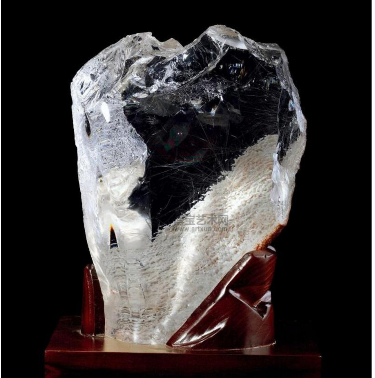
45, 清水晶船 长 14cm 高 5.5cm 座高 3cm RMB 9000-12000