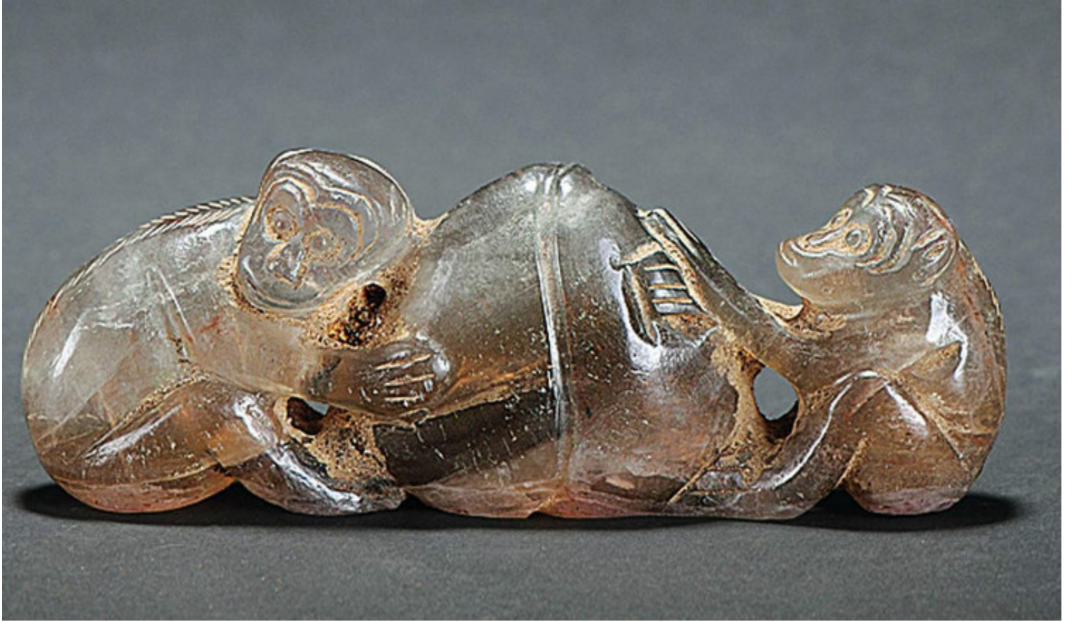
50, 清 水晶瑞兽 H7cm RMB 6900