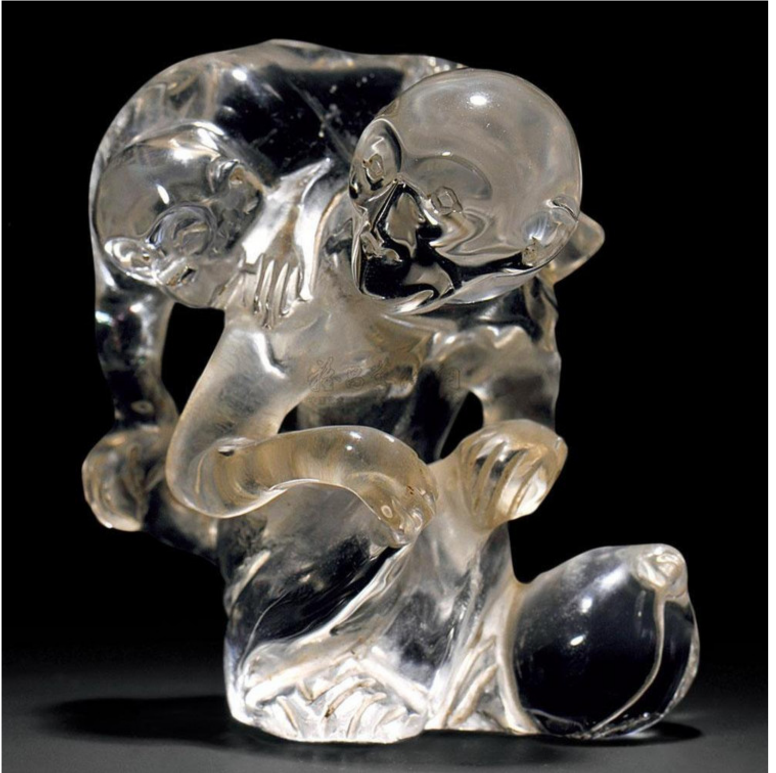
52, 清 水晶仙鹤摆件 (一对) H12.5cm RMB 15000