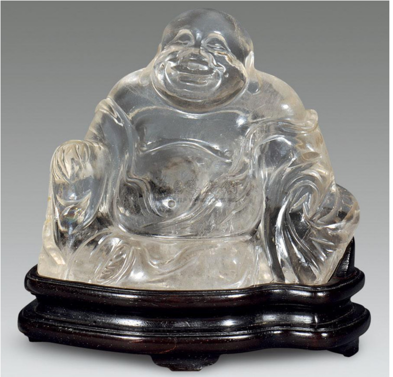
60, 清 水晶弥勒像 L10cm RMB 12000-22000