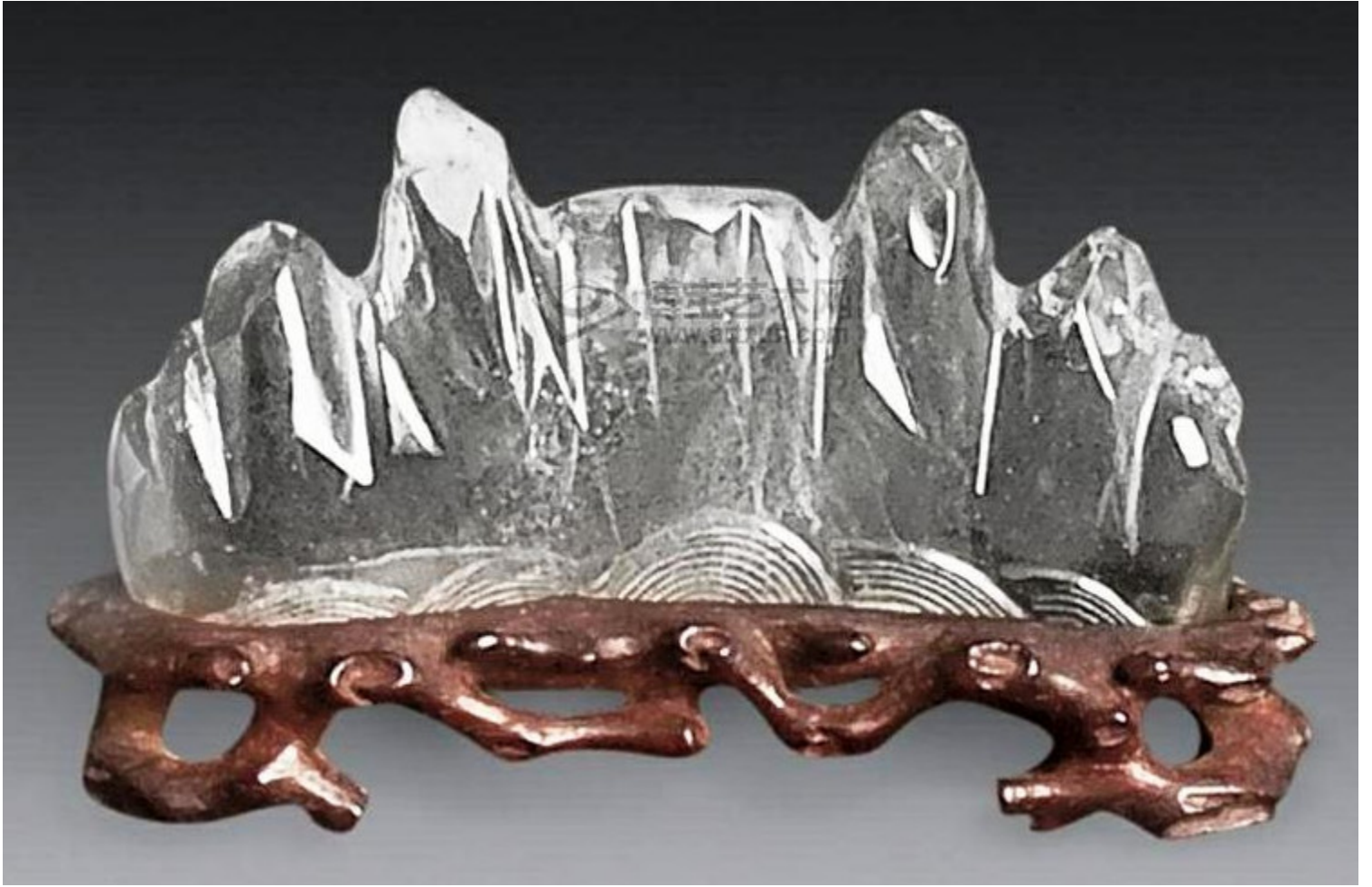
44, 天然水晶银发原石摆件 31×22×12cm RMB 172500