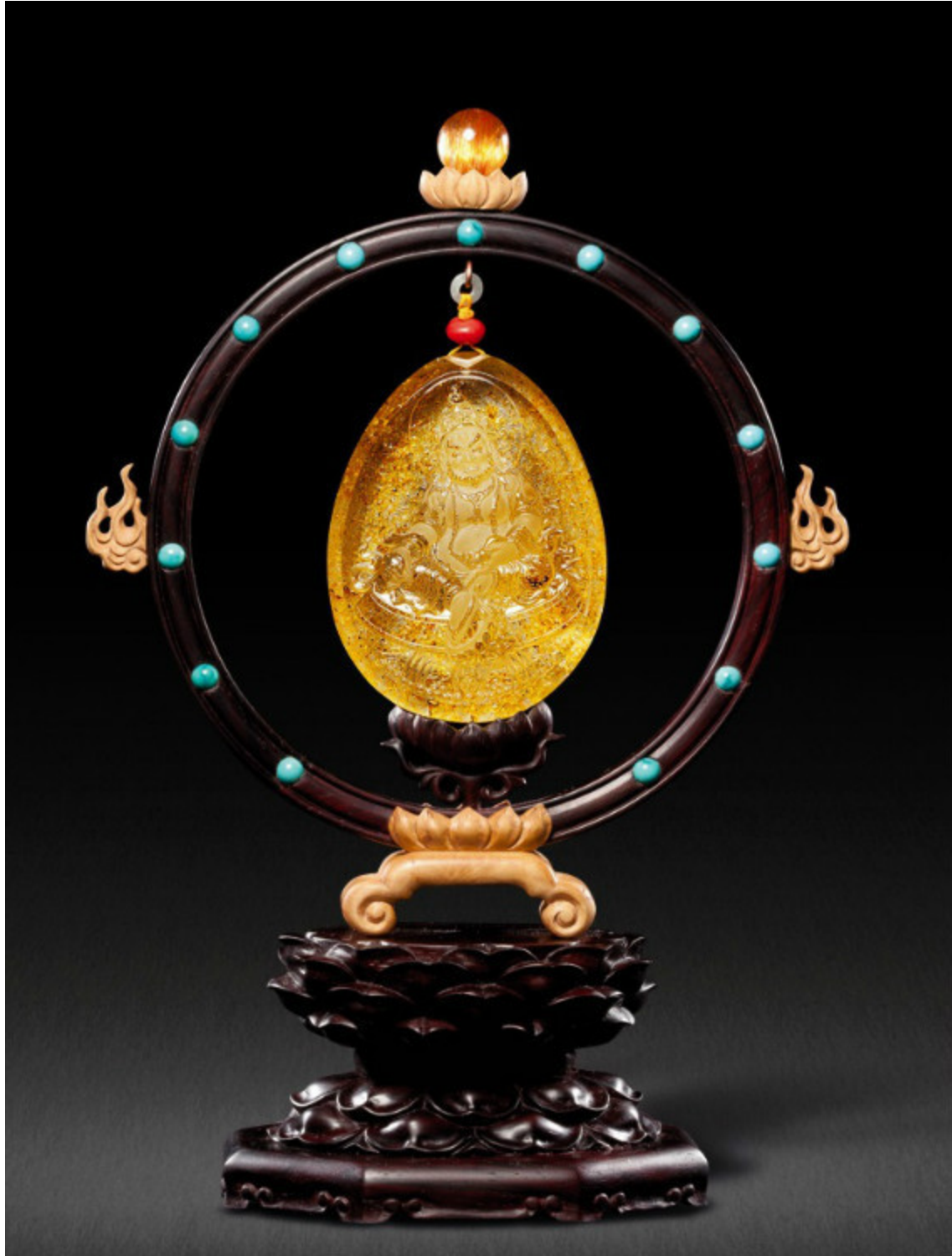
48, 水晶寿桃 RMB 3500