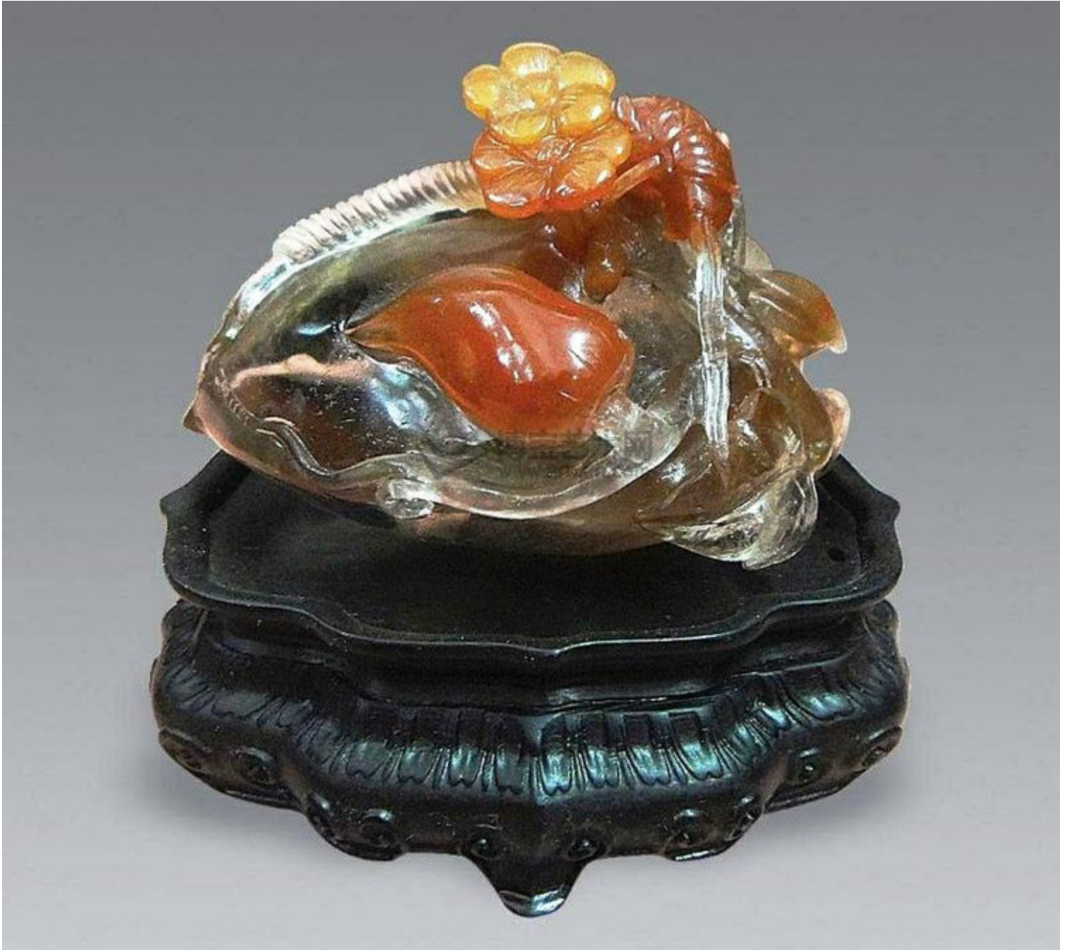
49, 清 水晶雕“双猴捧寿”摆件 L 12.5cm