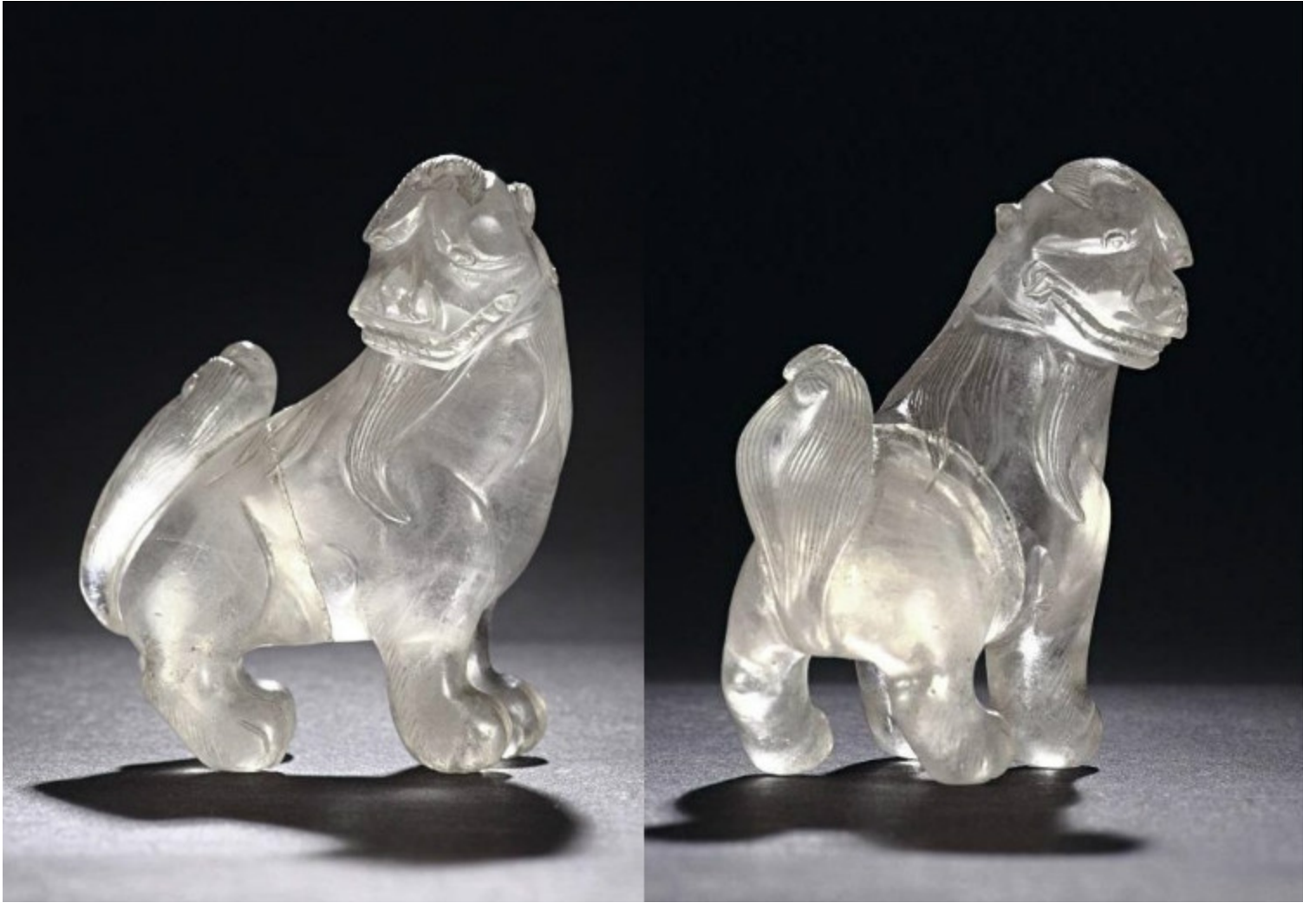
51, 清 水晶双猴小件 H6cm RMB 5750