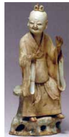
圖-4 傅珂舊藏 (Falk Collection) 「道士像」，2001年10月紐約佳士得拍出 (0106號)。