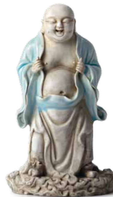
南宋 湖田窯影青露胎開心羅漢 Southern Song Dynasty Hutian Kiln Celadon Happy Luohan

自元以後，除了關注工藝技術水準的提高帶來瓷器裝飾的變化外，更重要的是中國繪畫、書法對瓷品裝飾的影響。明·陳繼儒《妮古錄》曾將磁州窯誤認作定窯，並評其書法為「字如米氏父子所書」，（請參考「元·磁州窯白地黑花詩文罐」，《唐宋陶瓷精品薦賞》，頁2~3）書藝幾與名家媲美。