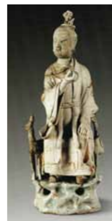
圖-2 「南宋觀音坐像」，上海博物館藏。詳見《中國陶瓷全集16—宋元青白瓷》圖76。