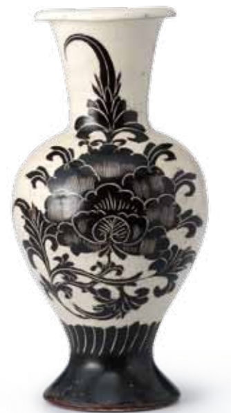
北宋 磁州窯白地黑彩剔牡丹花橄欖瓶 Northern Song Dynasty Cizhou Kiln White Olive-Shaped Vase with Black Engraved Peony