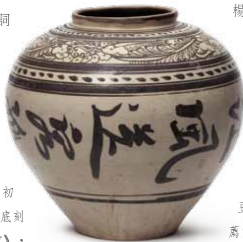
元 磁州窯白地黑花詩文罐 Yuan Dynasty Cizhou Kiln White Ground Black Pattern Jar with Inscriptions of Poetry

宋瓷無論造型或裝飾，都隱合理學和禪宗的身影，崇尚簡約淡泊、自然樸實的審美情趣。像南宋臨濟衍派楊岐、黃龍，皆立山於江西，使得景德窯場風行燒造諸佛、菩薩、羅漢等佛教塑像。（請參考「南宋·湖田窯影青露胎開心羅漢」，《唐宋陶瓷精品薦賞》，頁22~23）不以雕飾嘩眾，唯以風格敦厚造型秀美取長，體現「應世」特點，祛除了不食人間煙火的神氣。（請參考「元·龍泉窯豆青釉瓷塑觀音龕」，《唐宋陶瓷精品薦賞》，頁14~15）另外，單色、靜斂的青瓷，劃花的白瓷都透出一種雋永含蓄之美，（請參考「北宋·磁州窯白地黑彩剔牡丹花橄欖瓶」，《唐宋陶瓷精品薦賞》，頁6~7）追求「高風絕塵」的境界，注重抒發意趣，表現「尚意」的審美情趣。