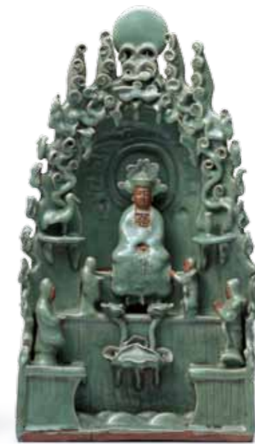
元 龍泉窯豆青釉瓷塑觀音龕 Yuan Dynasty Celadon Glazed Ceramic Miniature Guanyin Niche, Longquan Kiln