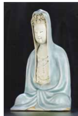
參考 繪影青釉造像，近來交投不俗，可參 2011-06-1 香港佳士得 Lot.3726 「南宋·青白釉觀音菩薩坐像」（成交價：25,300,000 港幣）。