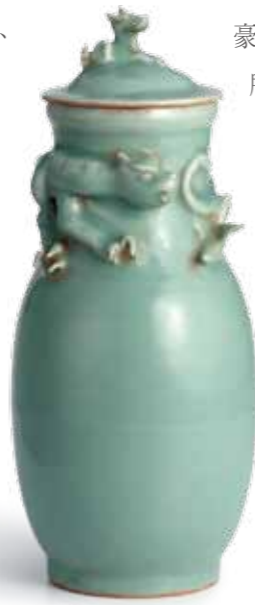
南宋 龍泉窯粉青釉蟠龍瓶 Southern Song Dynasty Longquan Kiln Celadon Vase with Dragon

宋代被稱為「瓷的時代」，宋人的詩詞書畫，包括宋瓷在內的藝術審美情趣，皆從唐代的「壯美」轉為宋代的「優美」；從「華麗」轉為後來「清麗」，青白瓷上所呈現的淡、樸、素的特徵，投合了宋代文人「清淡高逸」的風尚，也契合了道家「大美至淡」的美學思想。（請參考「明初或更早·鈞窯天藍釉海棠洗（盆托，底刻「五」字款）」，《唐宋陶瓷精品薦賞》，頁18~19）這種清淡、素樸的美，體現在美學感受上，即老子所稱之「光而不耀」、「不居其華」，如同青白二色不求華麗、不事張揚。終宋之世，只有「素以為絢」的樸素美，既沒有秦漢時期禮文化的束縛，更不見盛唐時期的視覺強烈的