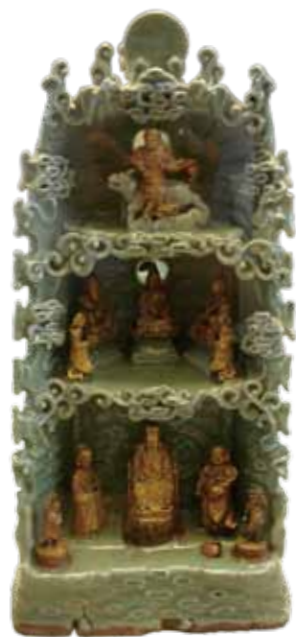
元 龍泉佛龕 大英博物館藏