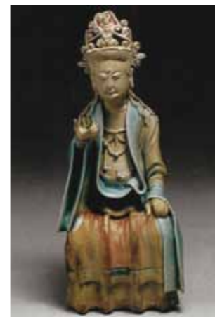
圖-3 1975年，江西鄱陽縣古墓出土「鶴鹿仙人象」。詳見《中國出土瓷器全集14—江西卷》圖70。