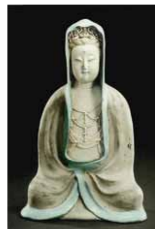
圖-1 1964年，北京豐台金代塔基出土「觀音像」，現藏北京首都博物館。詳見《中國文物精華大典—陶瓷卷》，頁290。