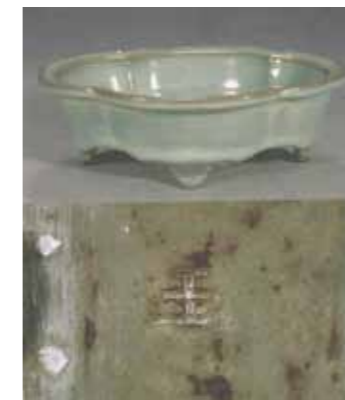
觀復博物館藏「鈞窯天青釉海棠式水仙盆」，（馬未都《說收藏·陶瓷篇》，頁 85）。

「五」字款鈞官窯，見 2008-5-27 香港佳士得《重要中國瓷器及工藝精品》Lot.1837「元/明初·鈞窯玫瑰紫釉鼓釘三足洗」（成交價：5,031,500 港幣）。