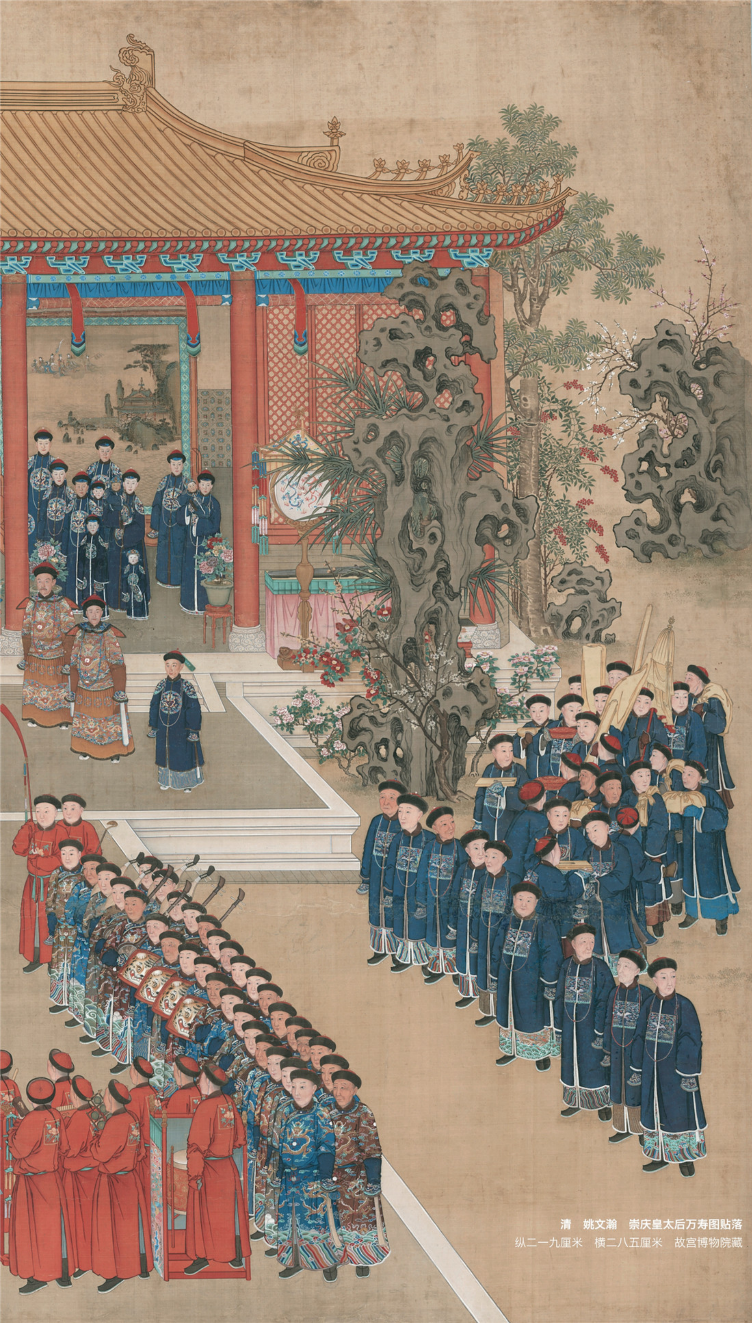
清 姚文瀚 崇庆皇太后万寿图贴落 纵二一九厘米 横二八五厘米 故宫博物院藏