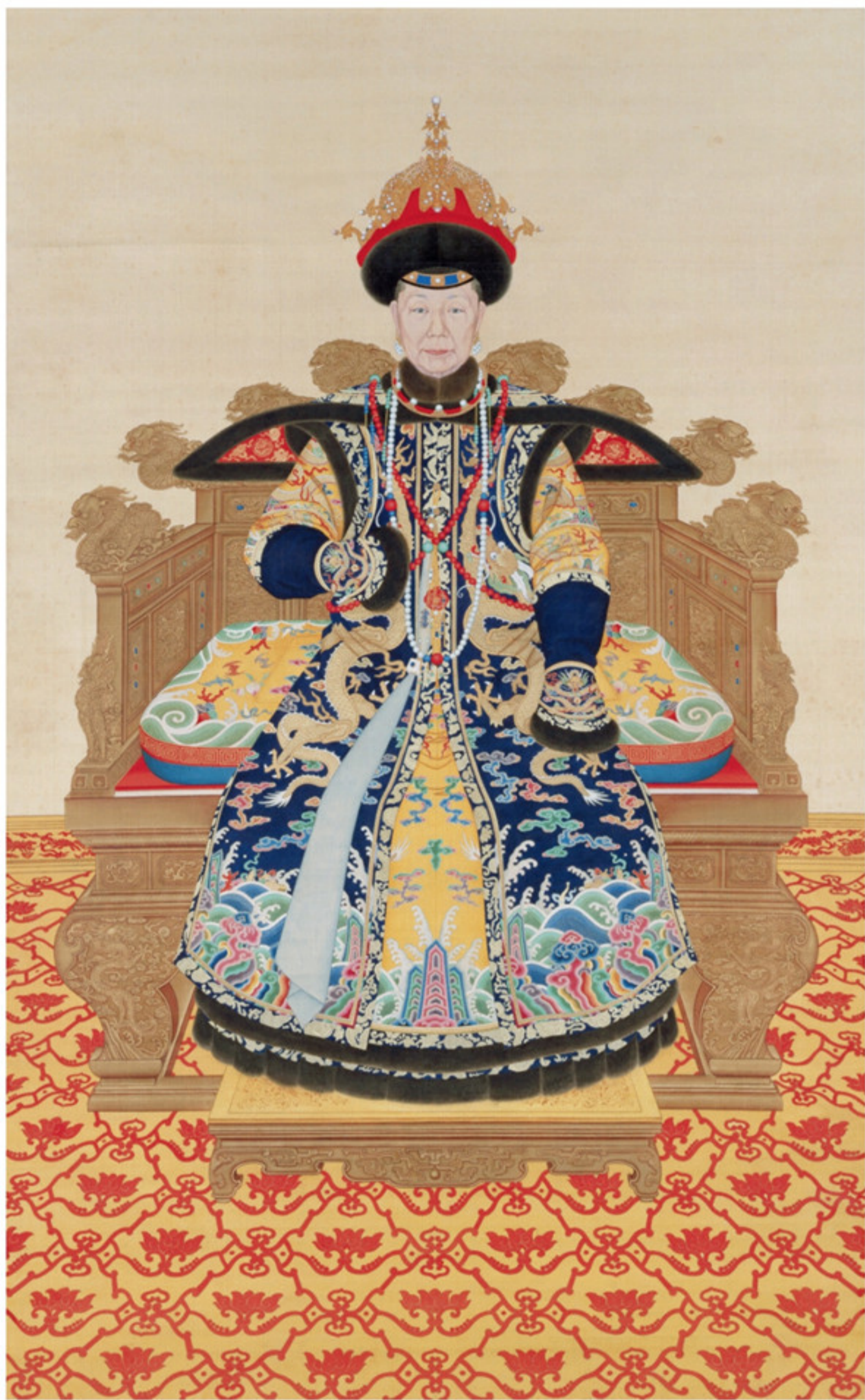
清人绘 孝圣宪后八旬像轴 纵二二八厘米 横一四〇·五厘米 故宫博物院藏