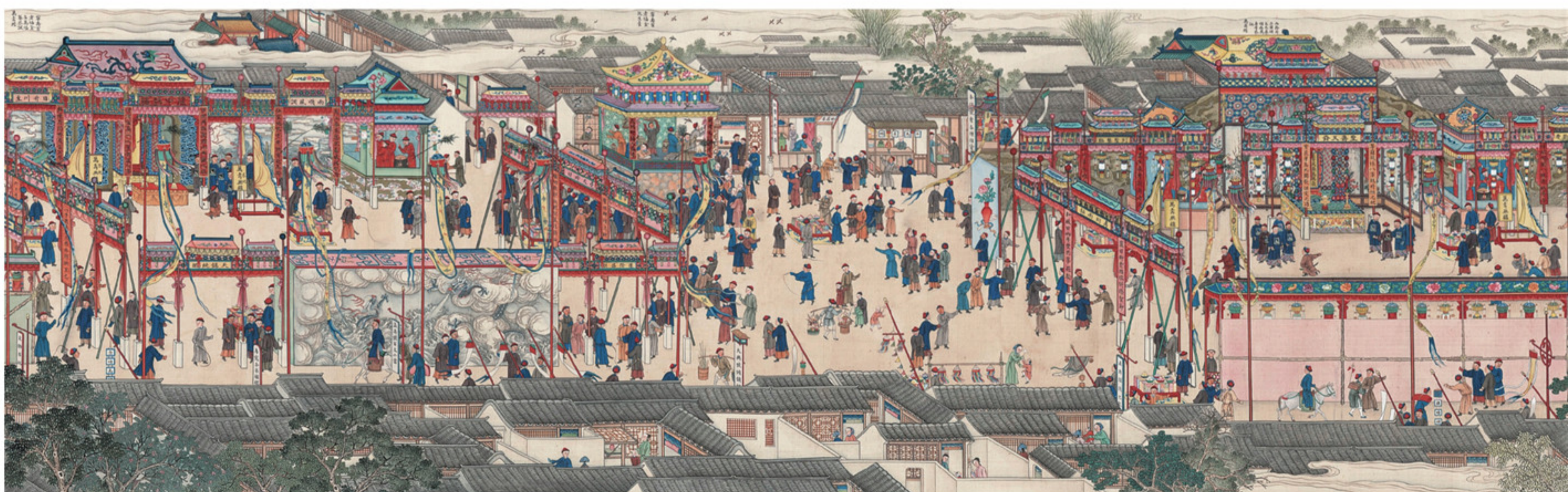
清人绘 万寿图卷（局部） 故宫博物院藏 为庆崇庆皇太后六旬万寿而作