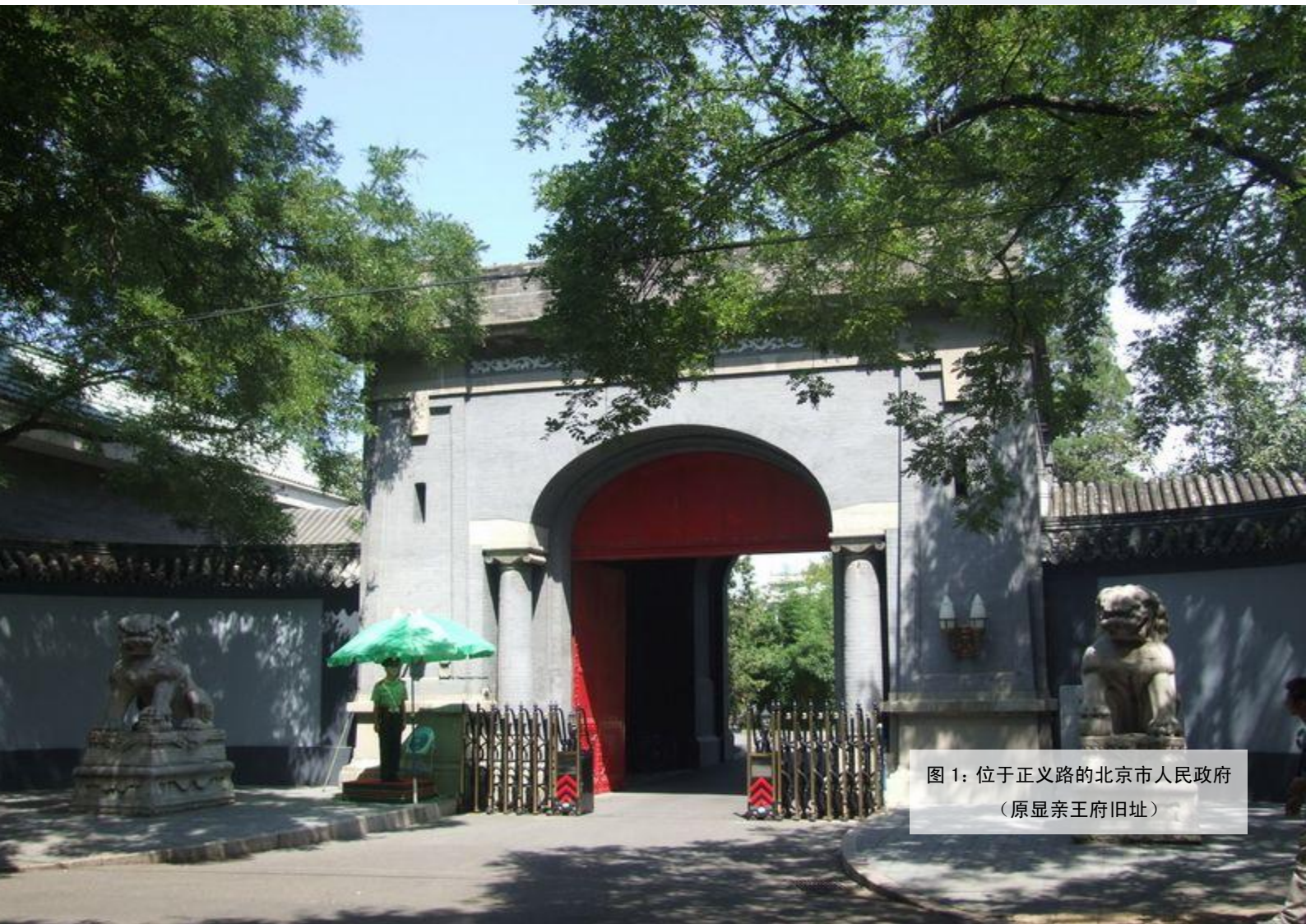
图 1：位于正义路的北京市人民政府 （原显亲王府旧址）

顺治年间建造的肃亲王府位于北京市东城区正义路东侧，是清太宗皇太极长子豪格的府邸。爱新觉罗·豪格，崇德元年（1636），以军功封肃亲王，掌户部事。顺治三年（1646），挂靖远大将军印，平定四川张献忠。次年，被多尔袞构陷，削爵下狱，不久死于狱中。顺治八年，追复封爵。顺治为豪格平反昭雪后，豪格子孙均以显亲王袭封，至乾隆四十三年（1778）才恢复肃亲王封号世袭。从乾隆十五年绘制的《乾隆京城全图》来看，当时肃王府还称为“显亲王府”。义和团运动后，肃王府被划为日本使馆，今为北京市政府所在地。