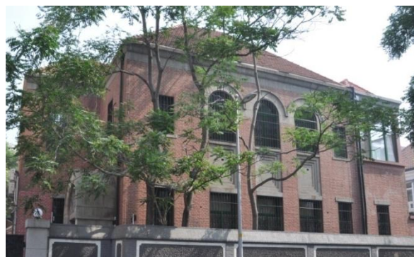
图 4：位于东交民巷内的日本公使馆旧址

现在的显亲王府旧址已为北京市人民政府，入口在正义路东侧，大门为西式建筑，门口两侧有境外站岗，显得庄严而肃穆。据说院内还保留一座日本明治时代建的西式楼房，现存主楼及大门。但我们无法进入，也不能在大门长时间停留和拍摄。而位于东交民巷的日本公使馆旧址虽然也建有围墙，但现在还依然可见其内部建筑。